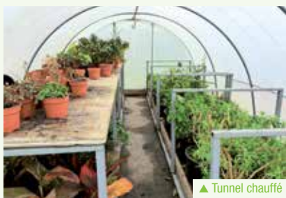
▲ Tunnel chauffé

Elles sont diverses et varient au gré des saisons. On peut citer la taille des arbres, des arbustes et des haies, la tonte, le ramassage de feuilles, l'élagage... sans oublier l'entretien des massifs et des terrains de foot du complexe sportif.